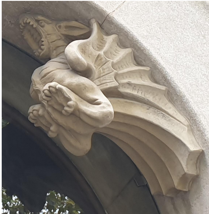
Dragón casa Morera.