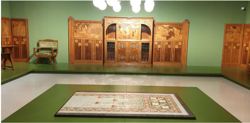
MNAC. Sala de estar Casa Lleó i Morera y pavimento dragón.