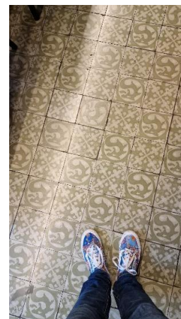
Ateneu Barcelonés, pavimento cafeteria.

En la búsqueda de ese misterioso tesoro olvidado, Clara descubrirá historias que nadie le había contado y se sumergirá en la Barcelona de inicios del siglo XX, cuando el mosaísta Florencio trataba de construir su futuro en una ciudad marcada por el crecimiento más allá de las murallas, el arte modernista y las reivindicaciones de la clase obrera.